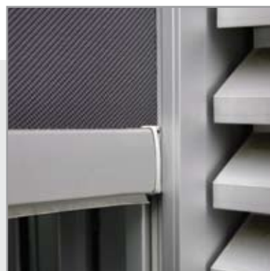
DETAIL DU GUIDAGE

RENSON Sunprotection introduit le FIXSCREEN®, un système de contrôle de la lumière et de la chaleur solaire qui offre de nombreux atouts supplémentaires. Par son volume compact, cette application est extrêmement appropriée pour le logement ainsi que pour les bâtiments tertiaires. Grâce à un système de guidage intelligent et breveté, la toile résiste au vent: avec le FIXSCREEN®, fini les toiles de stores qui claquent et se déchirent. FIXSCREEN® est fabriqué sur mesure jusqu'à une surface maximale de 18 m 2 en une seule pièce. Si vous voulez ventiler intensivement, les insectes sont repoussés totalement. Une barre de charge munie d'une bande d'étanchéité établit une jonction parfaite avec le seuil. Avec une toile adaptée, les salles de vision, les labos et les chambres à coucher sont obscurcis complètement. Le FIXSCREEN® peut être placé à l'intérieur ainsi qu'à l'extérieur.